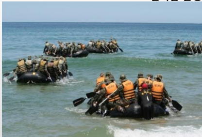
워크샵 - 해병대