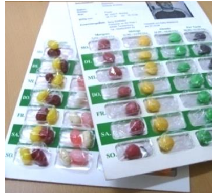
유럽 Blister Type 고가의 조제비용 발생