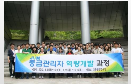
워크샵 - 계층별교육