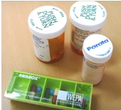
미주 Bottle Type(노약자) 계수능력 떨어지는 환자, 약화발생