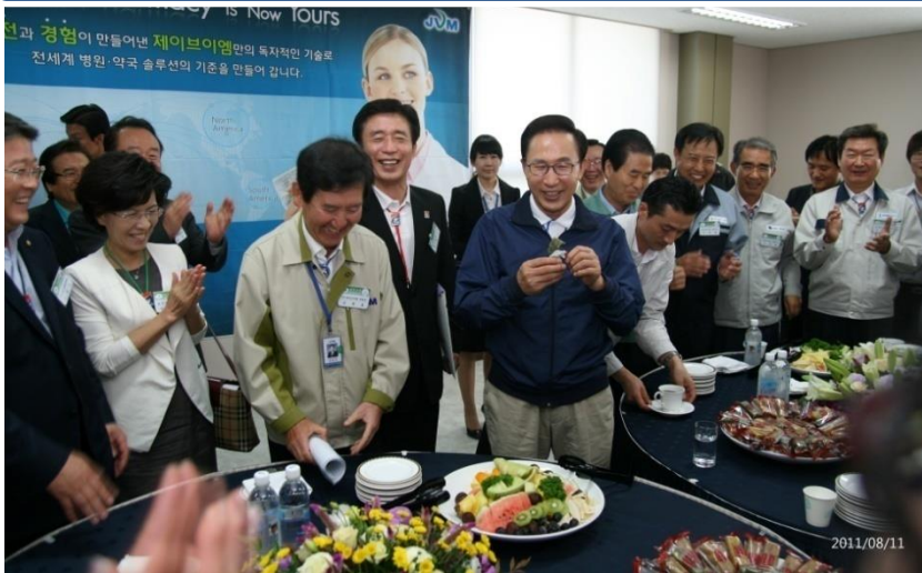
2011년 중소기업인 간담회 개최 (본사)