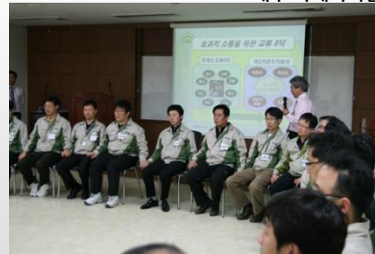
워크샵 - 계층별교육