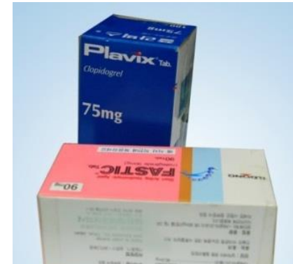
중국/유럽 Box Type 약 오남용 발생