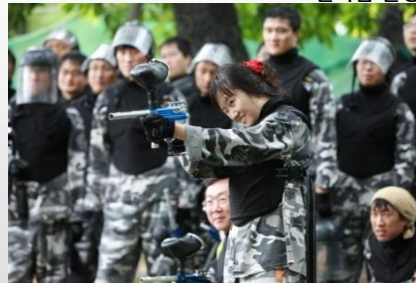
워크샵 - 서바이벌